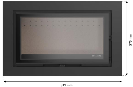
c) MO1160P076 d) MO1160P090