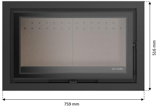
a) MO1160P082 b) MO1160P089